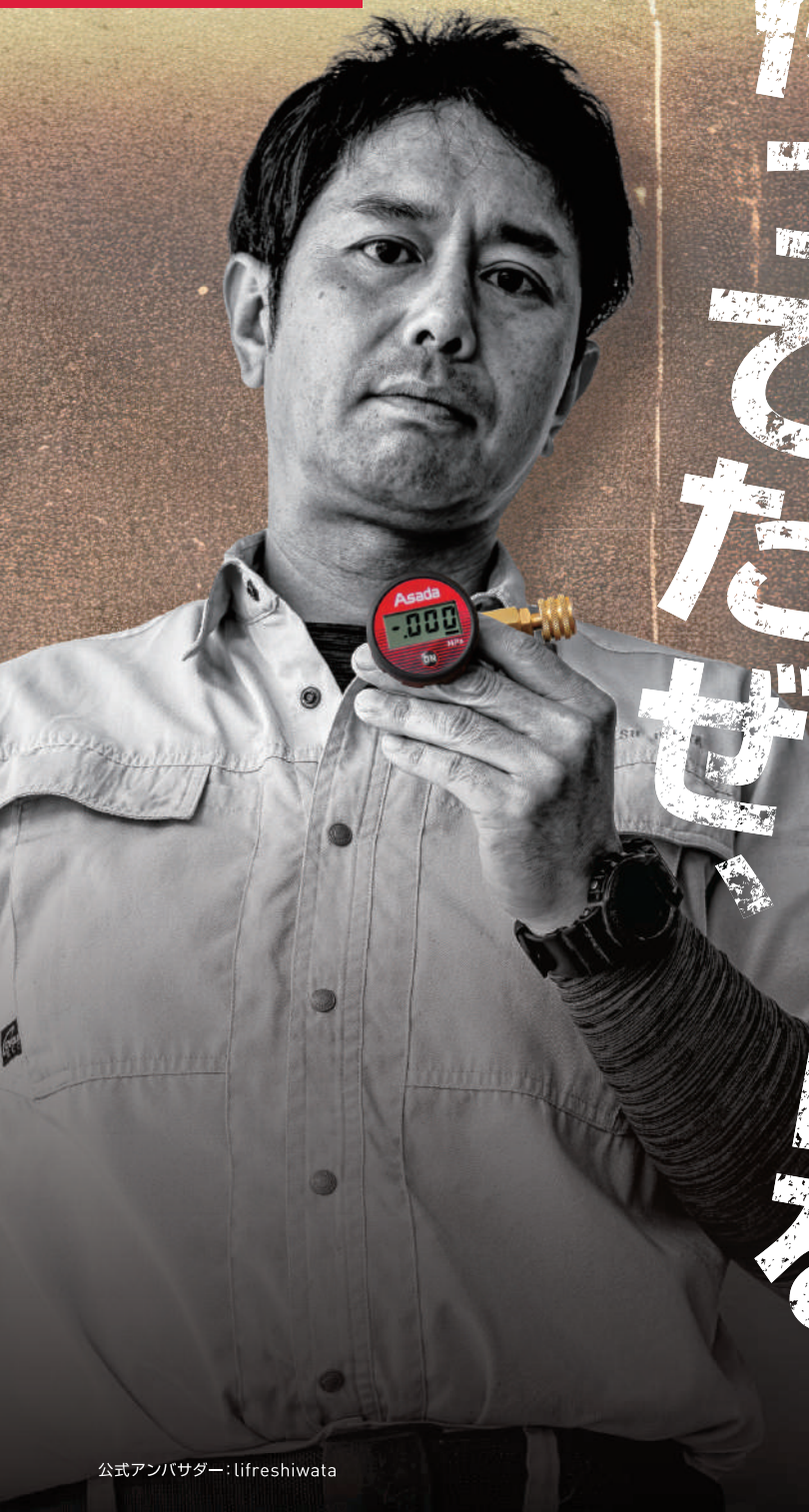
公式アンバサダー: lifreshiwata