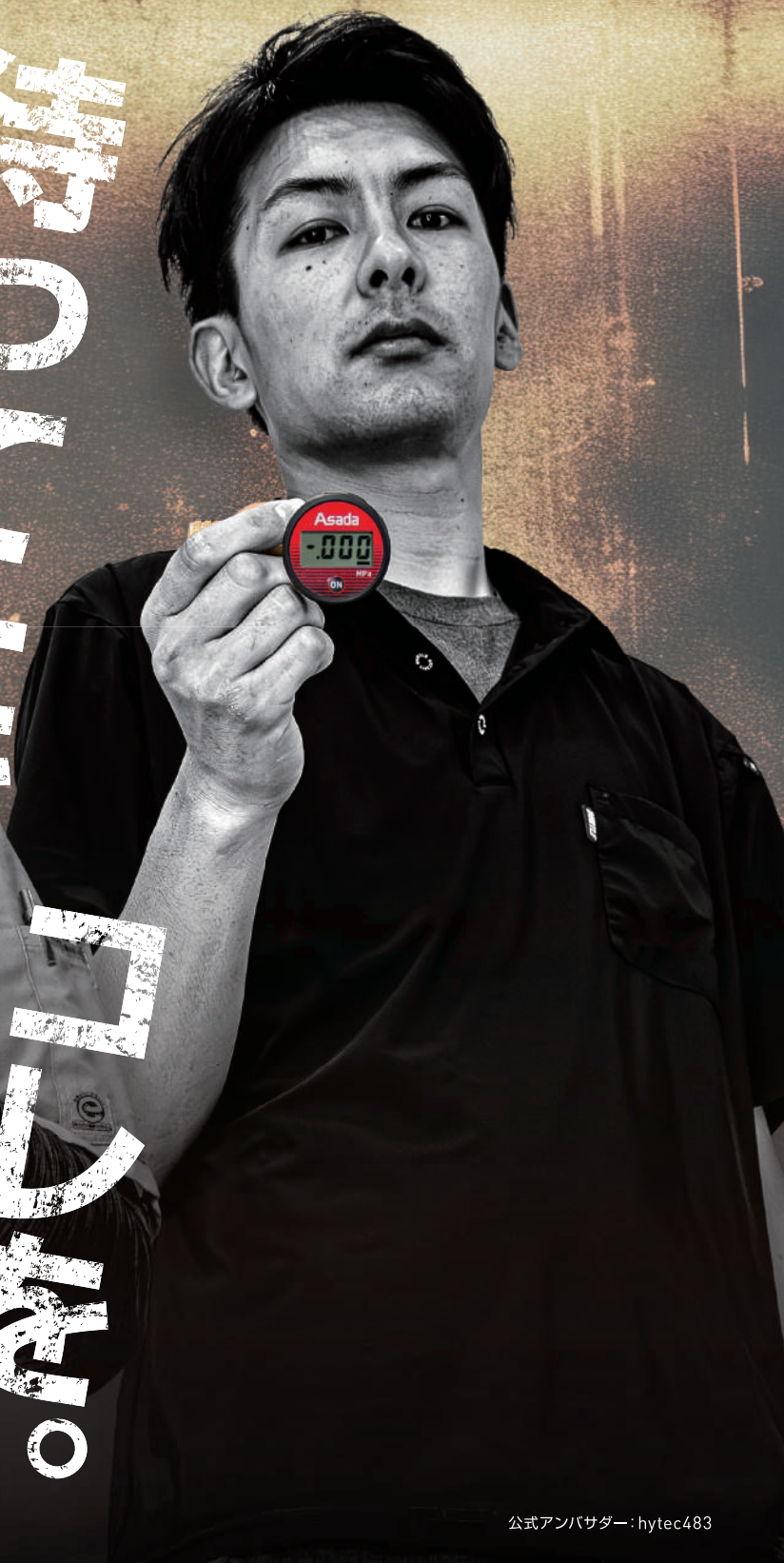
公式アンバサダー: hytec483