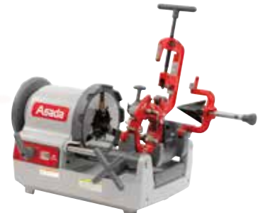
ビーバー-100 ATII 標準価格：999,000円