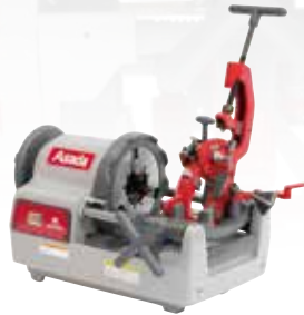
ビーバー-80 ATII 標準価格：597,000円