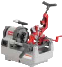
ビーバー-25 標準価格：247,000円